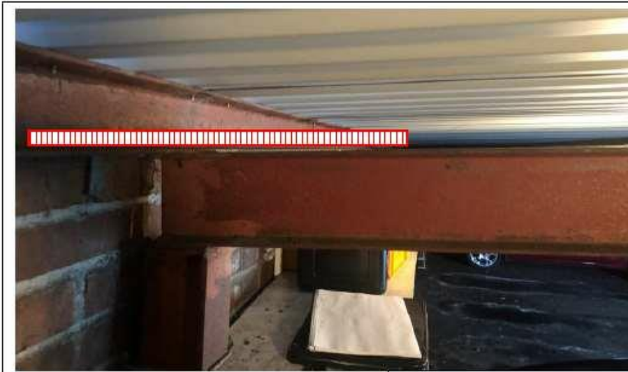
Röd Linje kanalisation och kabelväg.